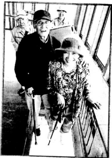
東京タワーで記念撮影♪足元注意？