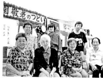
ちんどん屋さんと「はい」ポーズ

敬老の集い 祝い膳 お品書き 松風焼き ぶりの照り焼き 野菜炊き合わせ （高野豆腐 椎茸 里芋 大根 人参 胡よ） さつま芋の金平 ほうれん草の菊花かえ 紅白なます お多福豆 紅白まんじゅう オレシゼリー 寿司（陸老 まぐろ 穴子 玉子） すまし汁